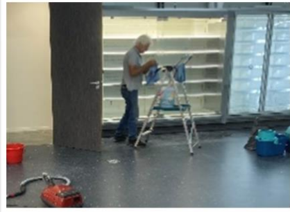
Vitrines in het pand tijdens schoonmaak